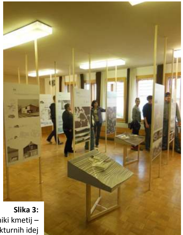
Slika 3: Študentje arhitekture v pogovoru z lastniki kmetij – predstavitev arhitekturnih idej